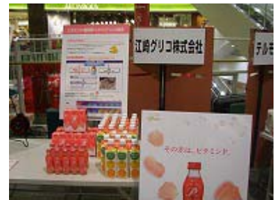
江崎グリコ株式会社様