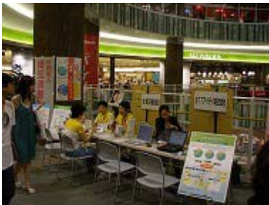
NTTアイティ株式会社様