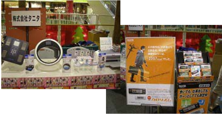
株式会社タニタ様