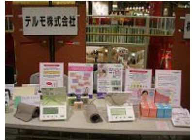
テルモ株式会社様