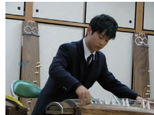
大川さんは転校先でお箏と出会いました